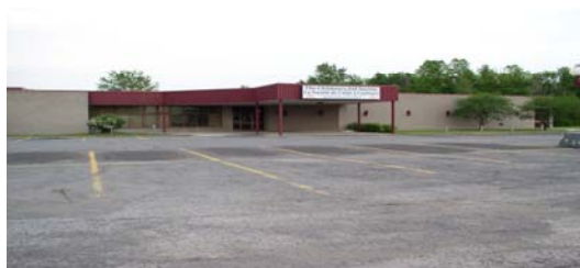
150, chemin Boundary Road Siège social —Head Office