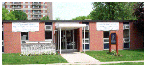
27, rue York Street Succursale—Branch Office